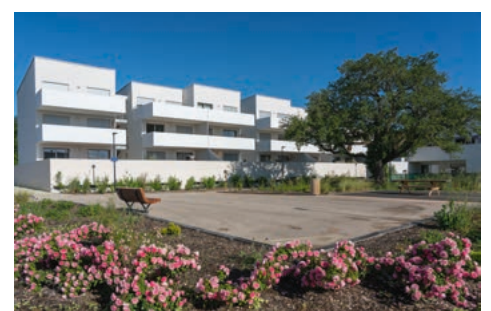
Des logements agréables à vivre et accessibles à tous