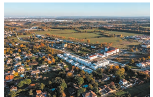
Un parc d'activités et d'artisanat dans un écrin de verdure

• Informez-vous sur les prochains travaux grâce aux nombreuses réunions organisées avec les habitants du quartier.