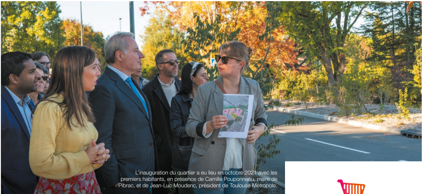
L'inauguration du quartier a eu lieu en octobre 2021 avec les premiers habitants, en présence de Camille Pouponneau, maire de Pibrac, et de Jean-Luc Moudenc, président de Toulouse Métropole.