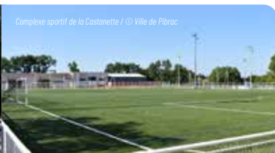
Complexe sportif de la Castanette