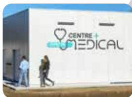
Centre médical Pibramedic