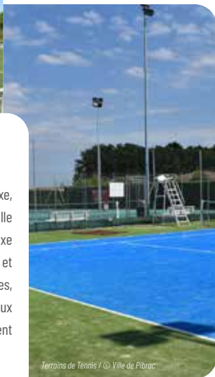
Terrains de Tennis